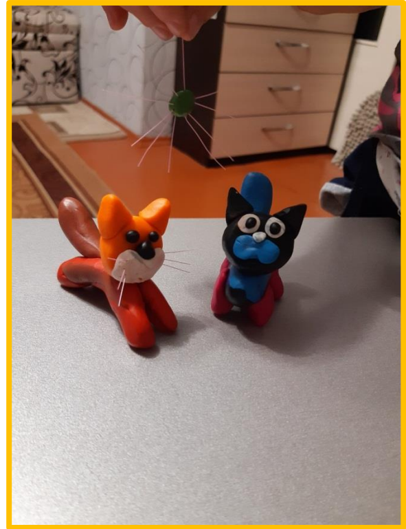
Рис. Семьи Димы Р.