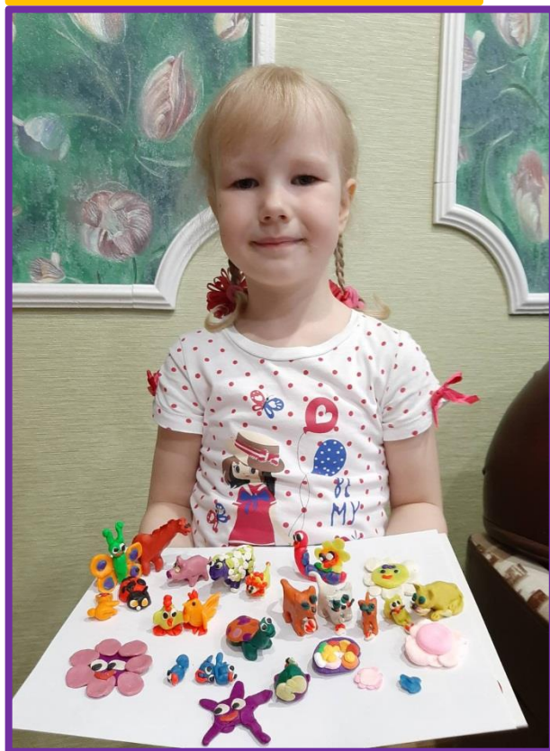
Работа «Собачка» Ромы Т.