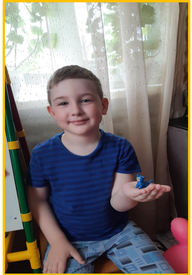
Задание по математике Кости М.